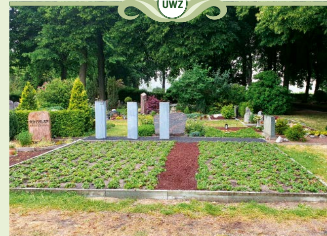
Urnwahlgrabstätte mit zentralem Grabmal