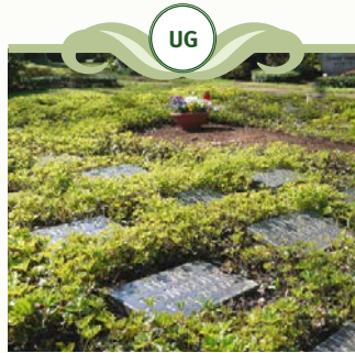
Urnenreihen- grabstätte - Gemeinschaftsgrab