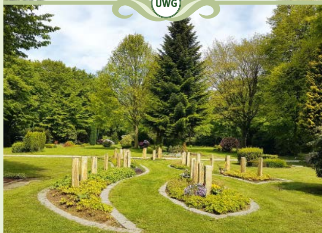
Urnwahlgrabstätte an einer Stele