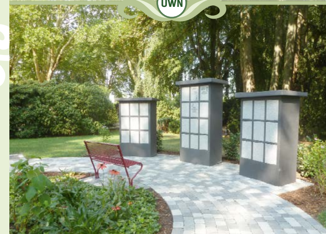
Urnwahlgrabstätte in einer Urnennische