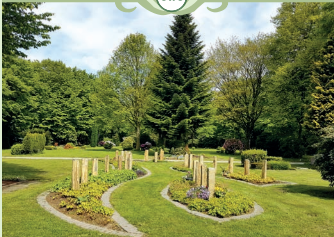
Urnenwahlgrabstätte an einer Stele