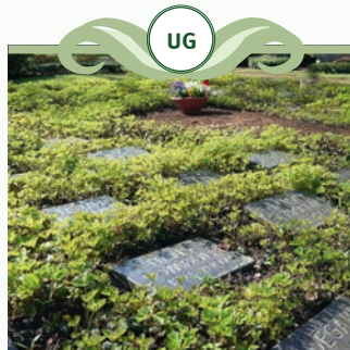
Urnenreihen- grabstätte - Gemeinschaftsgrab