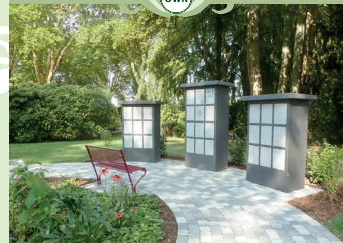
Urnenwahlgrabstätte in einer Urnennische